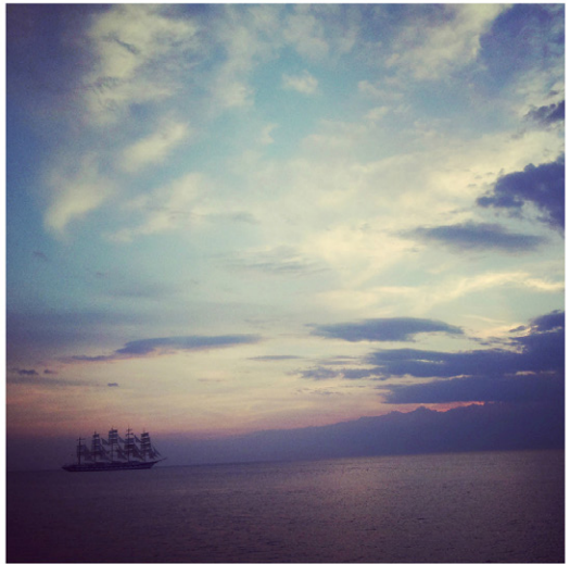
Izseki iz Čudežne dežele, 2018, giclée art print, 60 x 60 cm