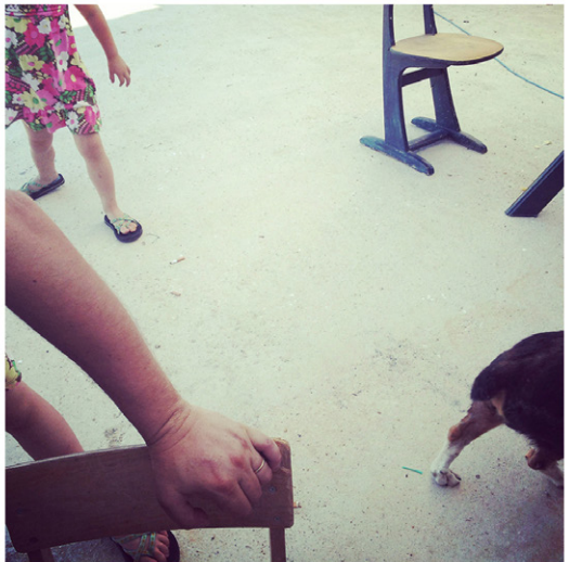
Izseki iz Čudežne dežele, 2018, giclée art print, 60 x 60 cm