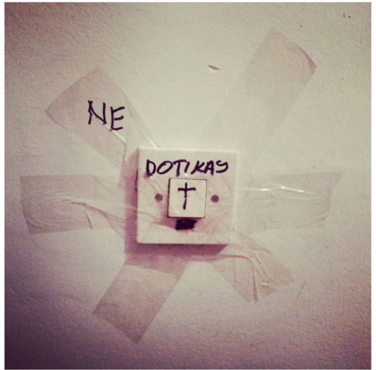
Izseki iz Čudežne dežele, 2018, giclée art print, 60 x 60 cm