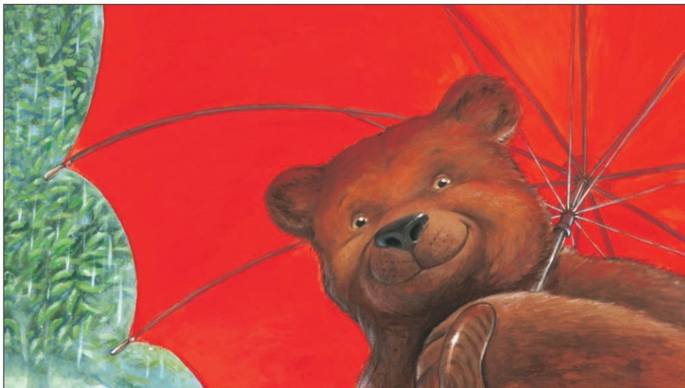
Pod medvedovim dežnikom - akril na papirju, Založba Mladinska knjiga 1998