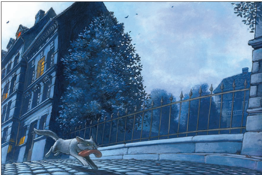
Smetiščni muc in druge zgodbe - akril na papirju, Založba Mladinska knjiga 1999