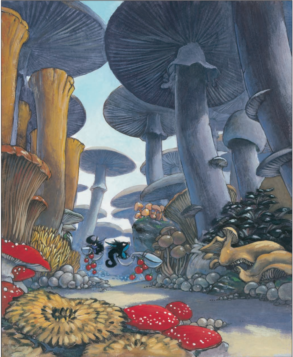
Kam pa kam, kosovirja? - akril na papirju, Založba Mladinska knjiga 2002