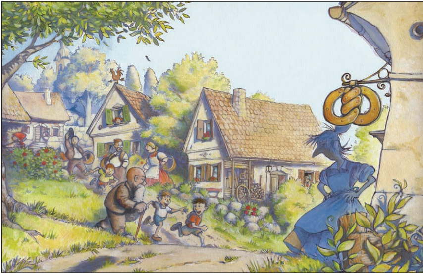
Pekarna Mišmaš - akril na papirju, Založba Mladinska knjiga 1997