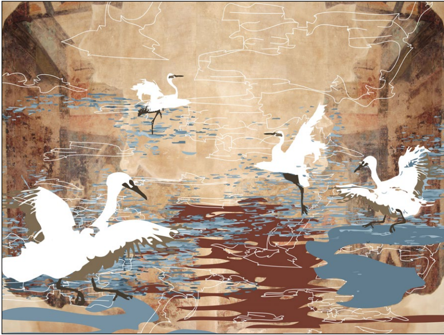
Svetišče ljubezni V. , 2015, giclée