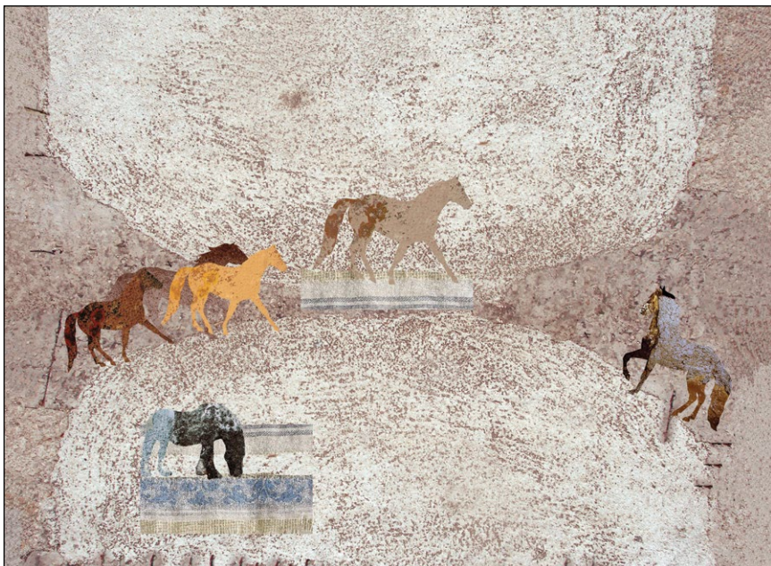
Pokrajina s konji , 2015, giclée