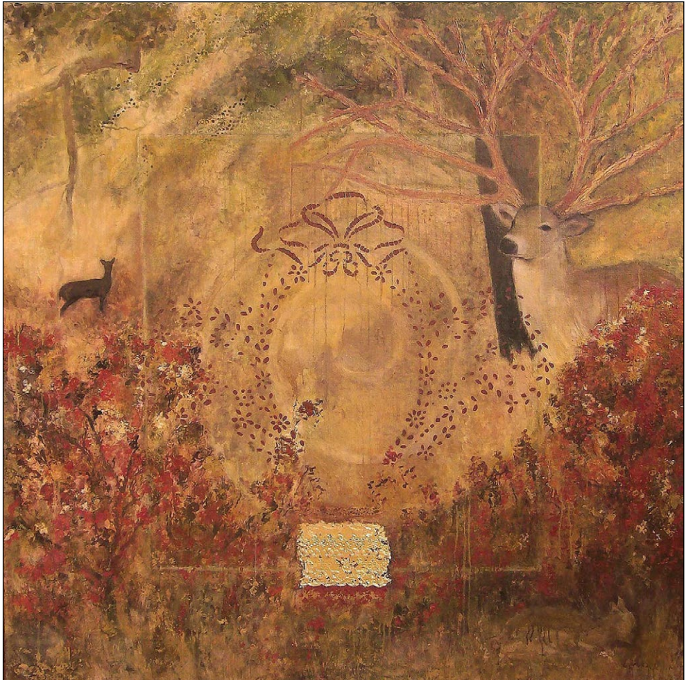
My Dear, my Deer, I shall guide you through eternal sphere, 2011, olje na platno, 140 x 140 cm