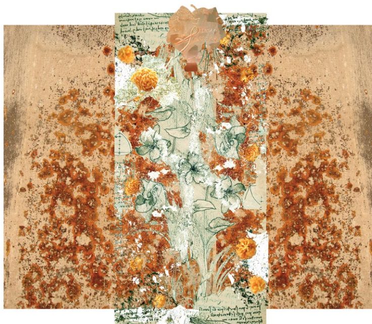
Senta 393. , 2013, giclée