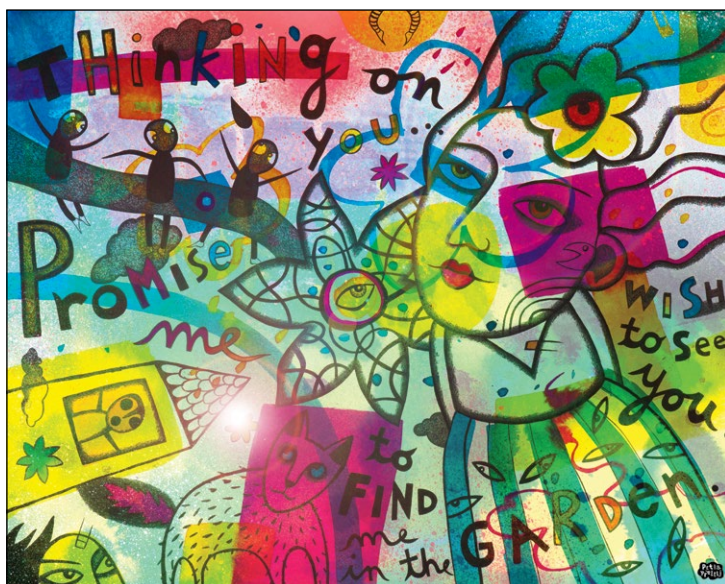
Thinking on you , 2015, mešana tehnika in giclée, 44 x 55 cm