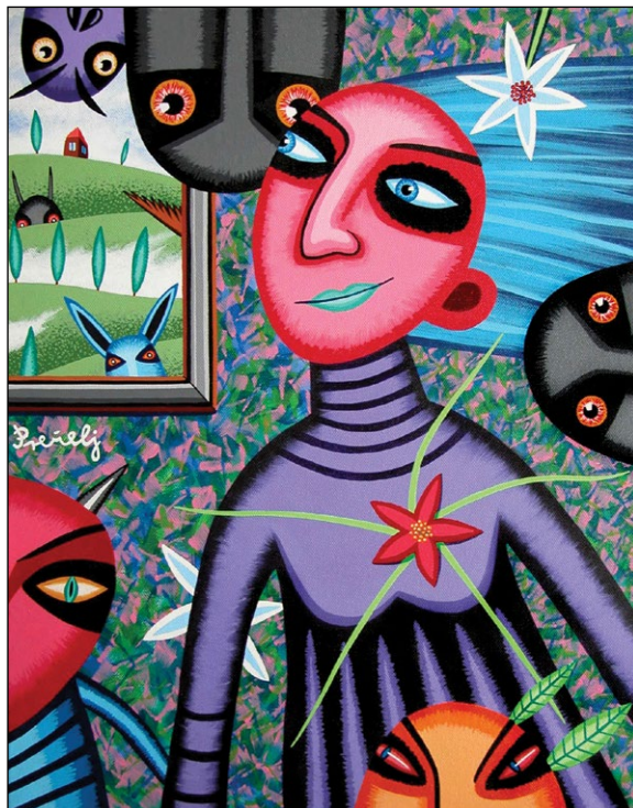
Želja, 2010, akril na platno, 50 x40 cm