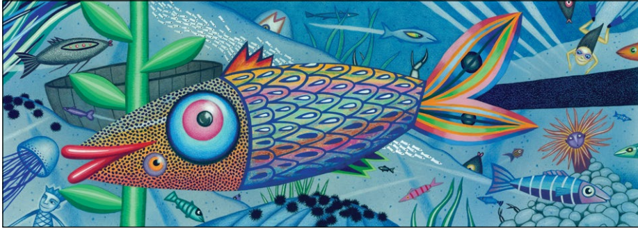
Deklica Maja , 2010, ilustracija, mešana tehnika, 21 x 58 cm