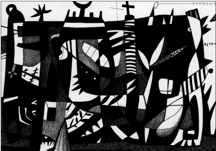
Zamegljenost spomina , 2001, tuš na papirju, 15 x 21 cm