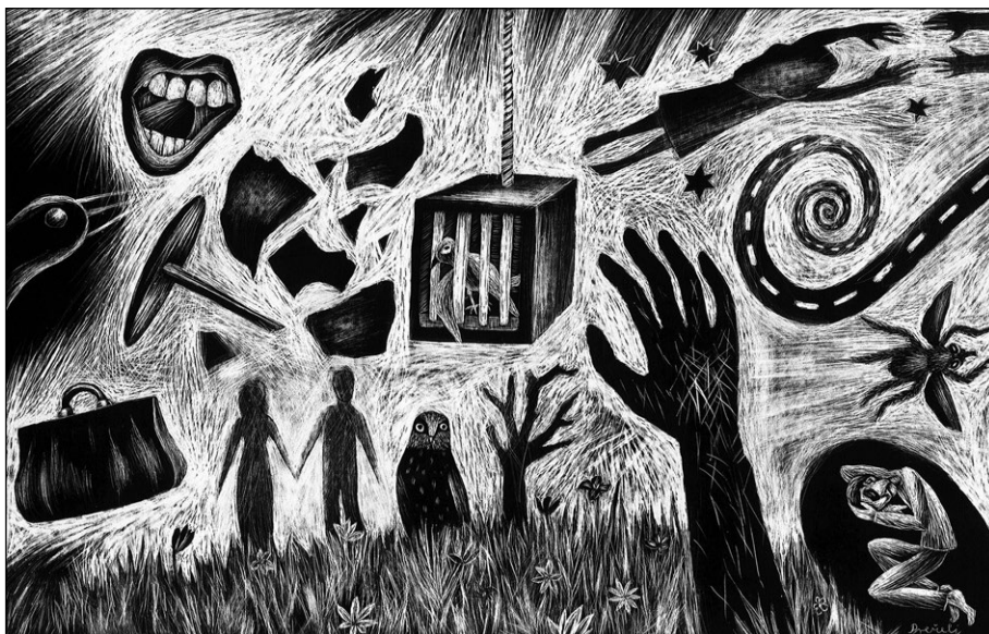
Noč, 2008, praskanka, 21 x 32 cm