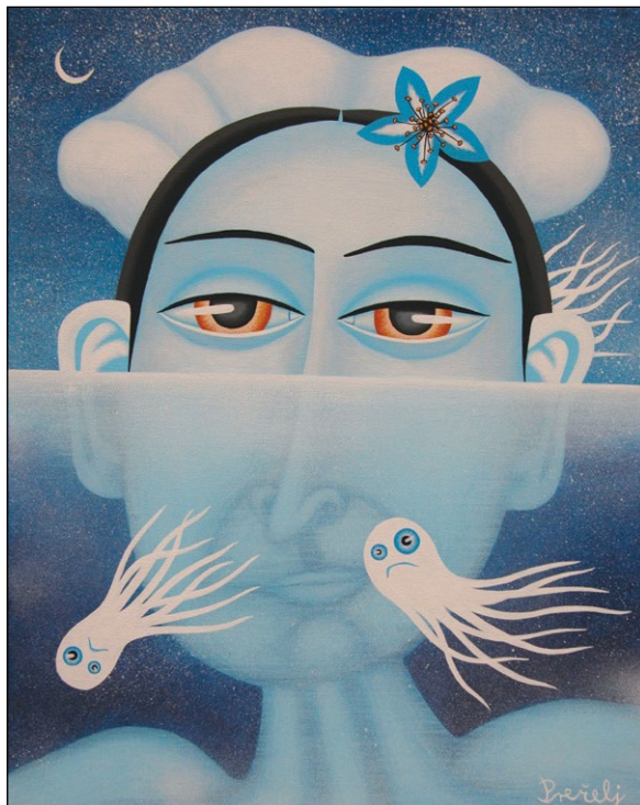
Zasajana , 2014, akril na platno, 50 x 40 cm