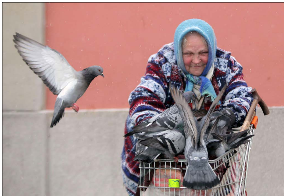
Najboljši prijatelji, 2013