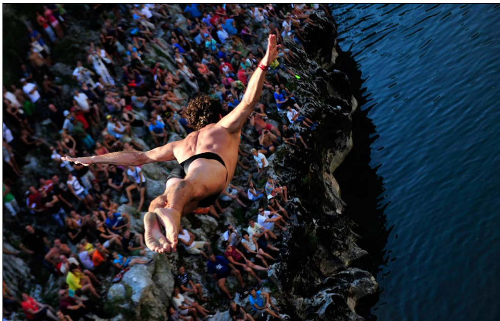
Delim s pticami nebo in z ribami vodo, 2013