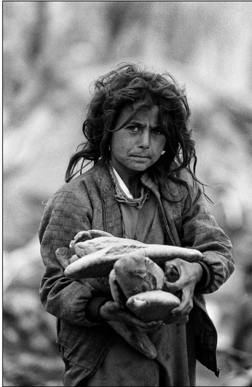
Priborjena dobrina, 1991