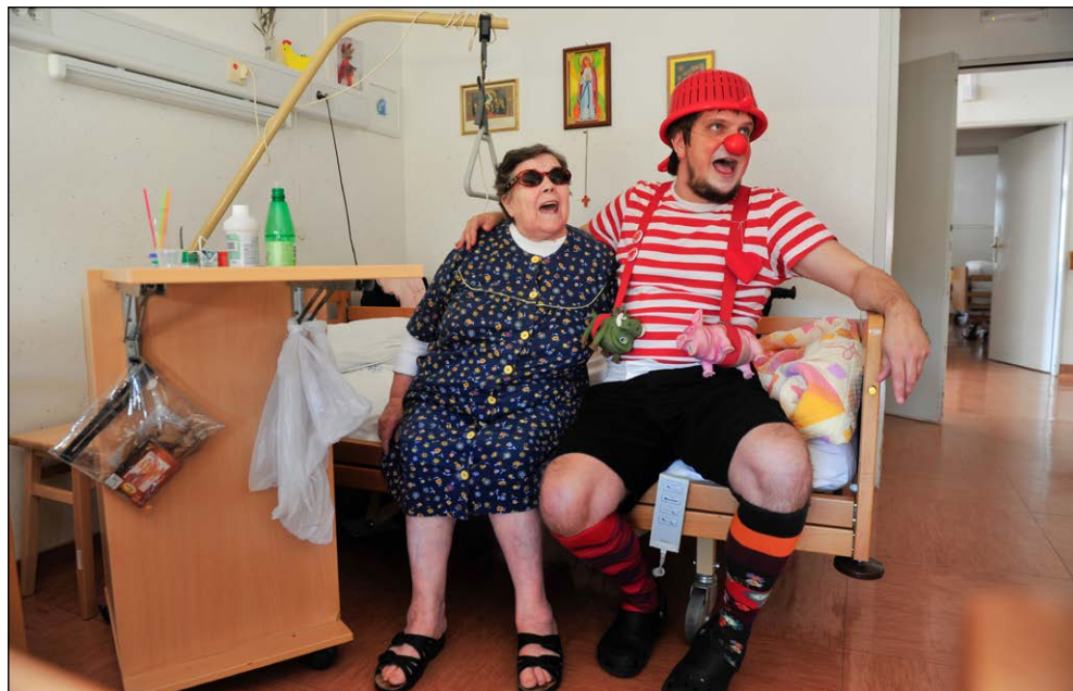
Pevske vaje, 2012