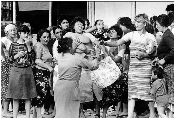
Boj za delavski kruh, 1989