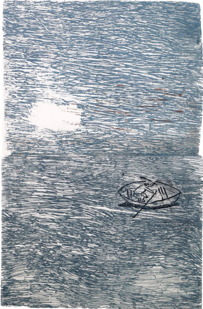
Morje , lesorez, 2018, 58 x 38 cm