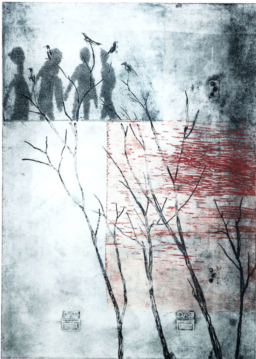
Vrane , kolagrafija, lesorez, 2019, 69 x 49,5 cm