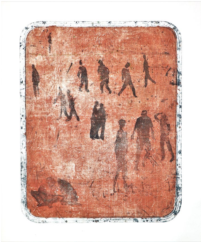
Park, jedkanica, kolagrafija, 2019, 59 x 47,5 cm