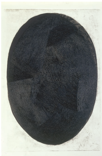
Luknja (iz ciklusa Temé lukenj), 2009, akvatinta in gravura, 90 x 61 cm