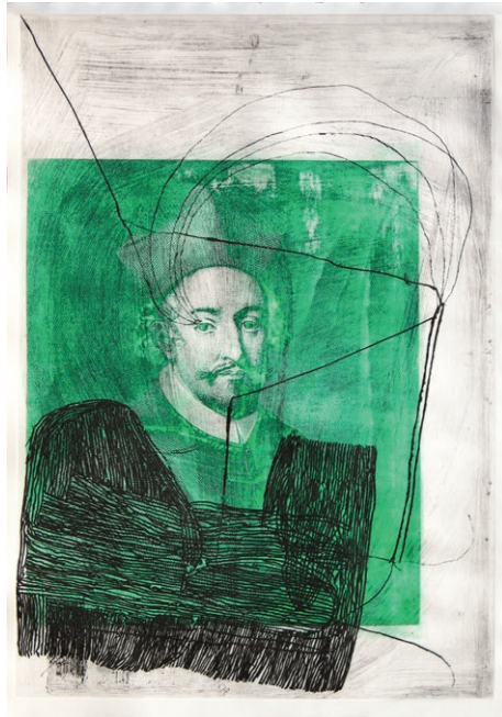
Matrica za kardinala Beatona, 2015, fotogravura, jedkanica in akvatinta, 95 x 65 cm