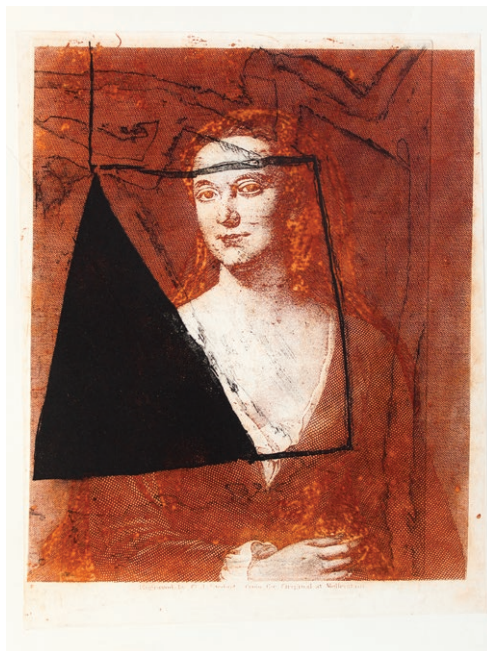
Matrica za lady Grisel Baillie II, 2015, fotogravura, jedkanica in akvatinta, 72 x 57 cm