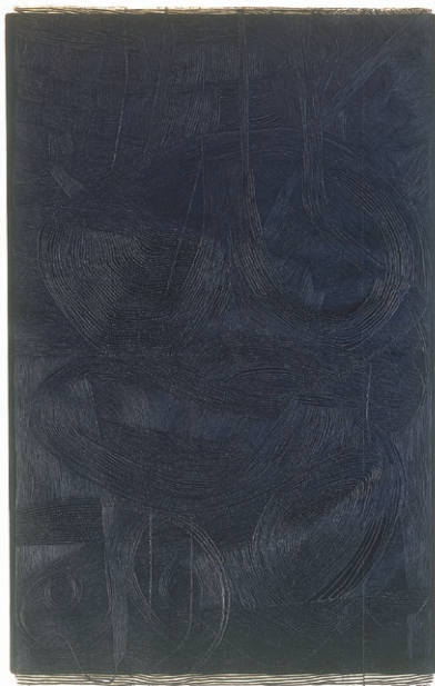
Luknja (iz ciklusa Temé lukenj), 2009, akvatinta in gravura, 97 x 60 cm