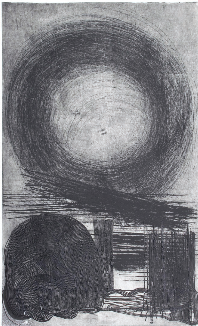
Brez naslova , 2019, gravura in suha igla, 160 x 100 cm