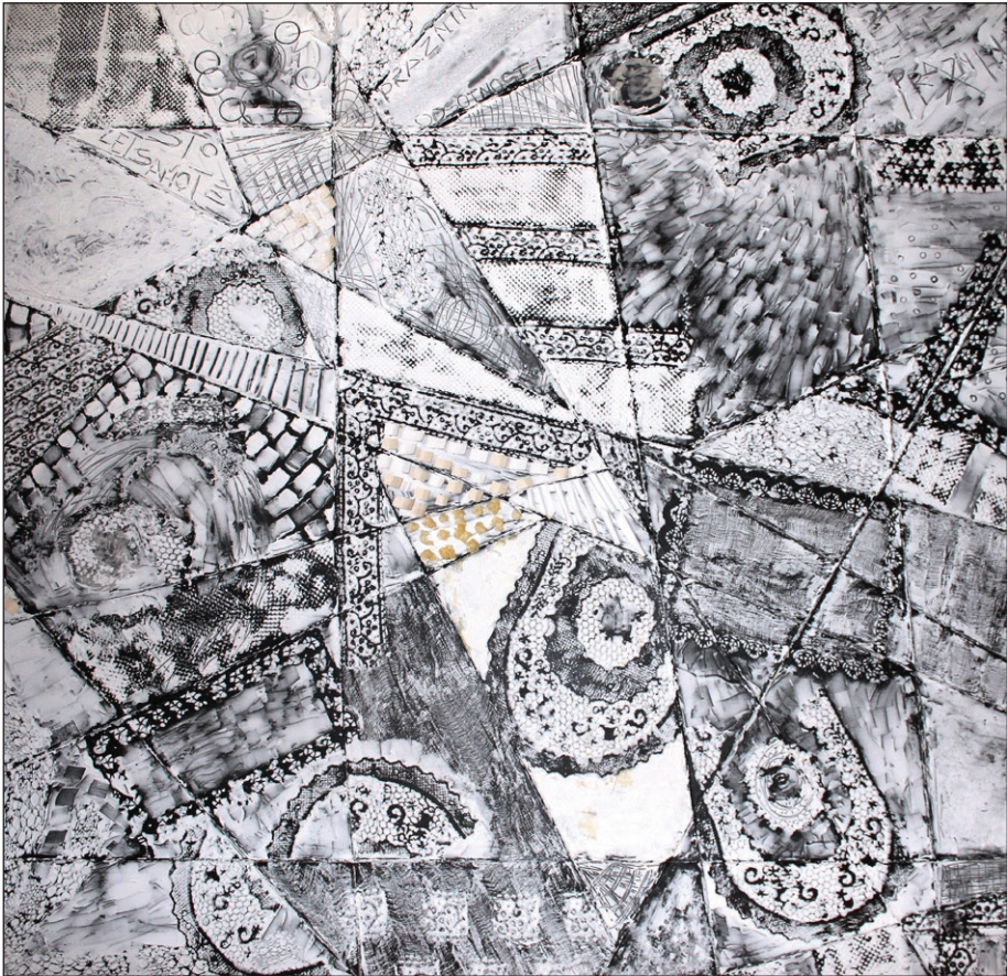
Prostori življenja II , 2015, akril/mešana tehnika, 150 x 150 cm