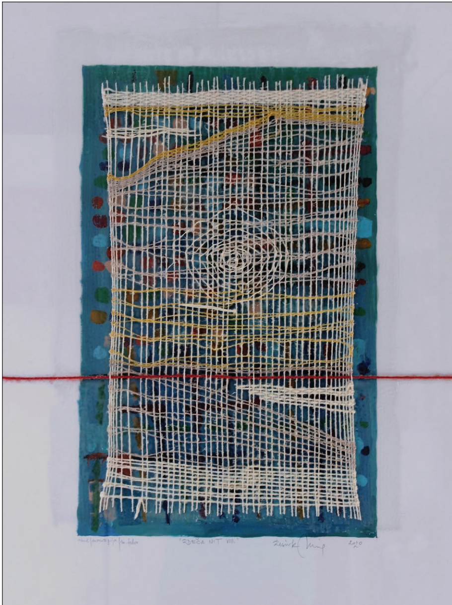
Rdeča nit VIII, 2020, akril/monotipija/mešana tehnika na papir in steklo, 80 x 60 cm