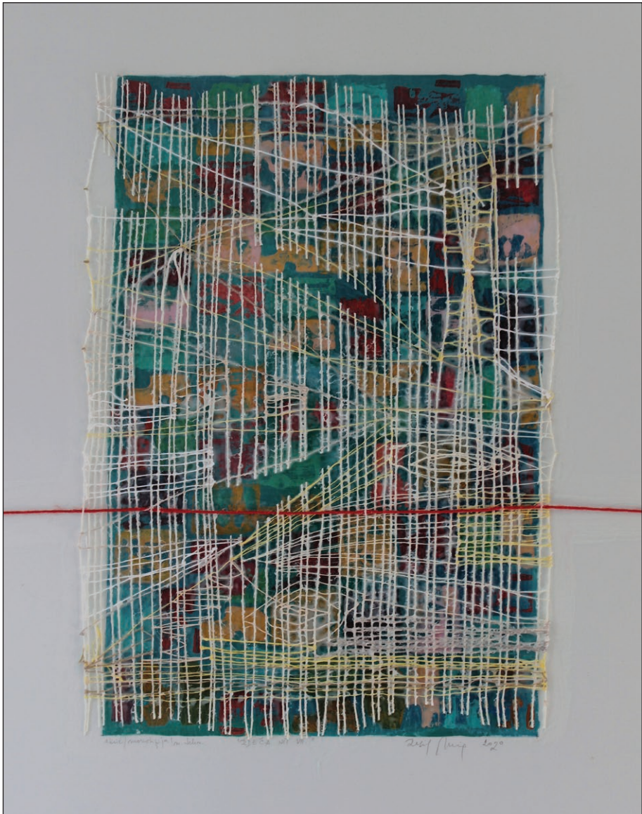
Rdeča nit VII , 2020, akril/monotipija/mešana tehnika na papir in steklo, 80 x 60 cm