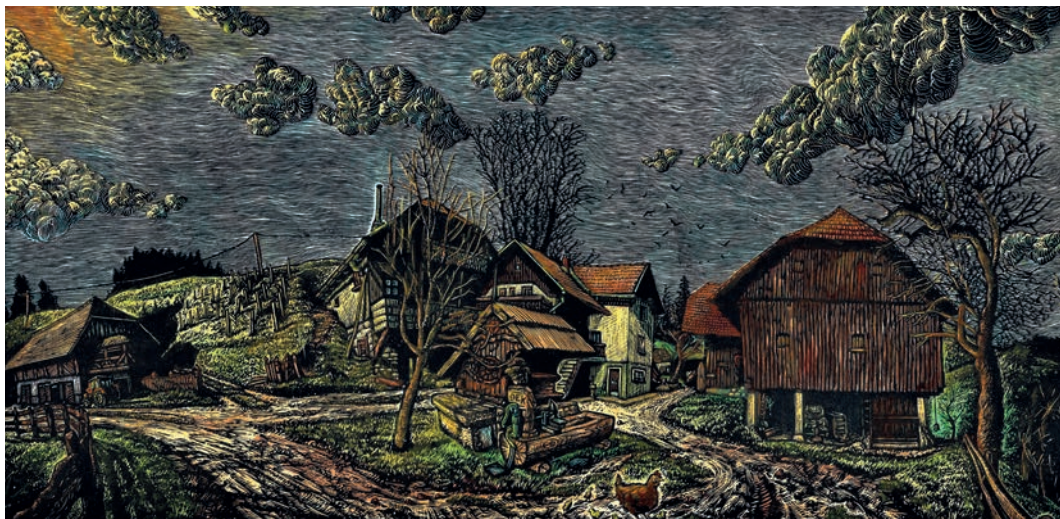
Pričnikova panorama, linorez, 2019