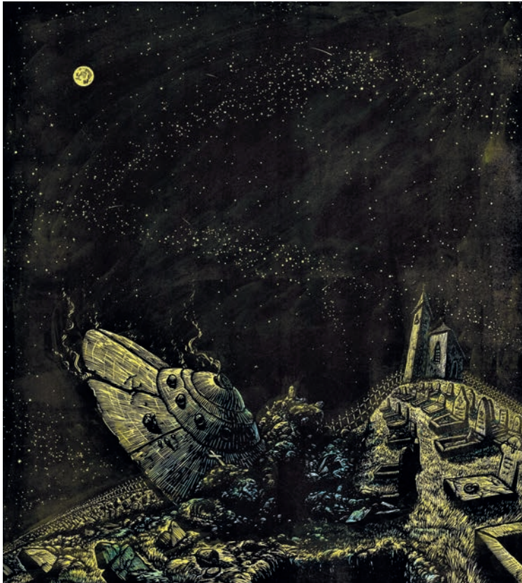
Bogovi so padli na zemljo, linorez, 2019