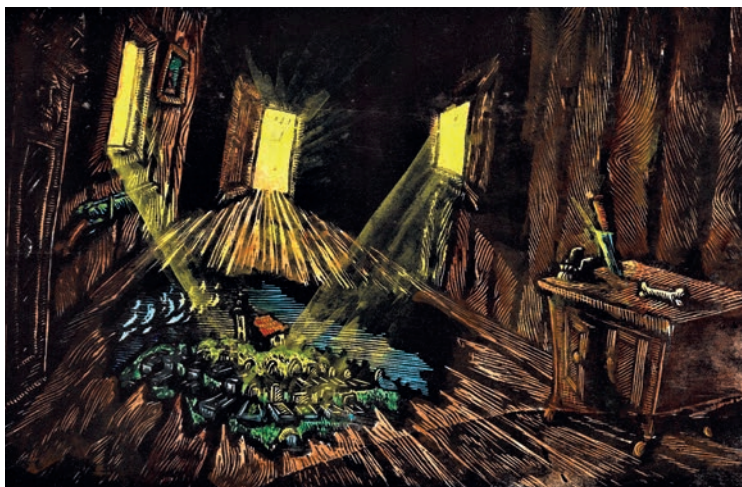
Zlomljena dimenzija človeštva, lesorez, 2018