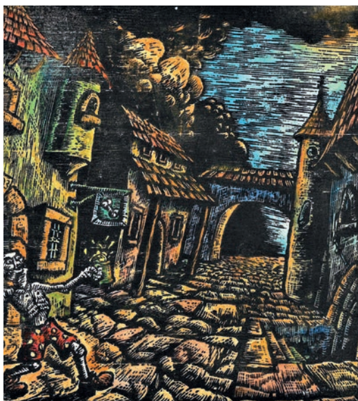
Pri stari Kosti, lesorez, 2019