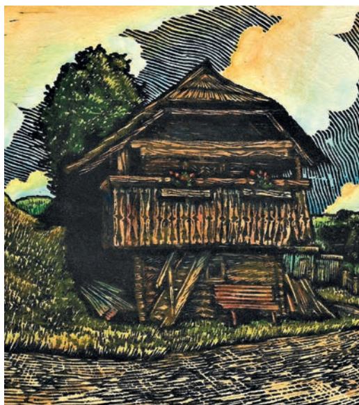
Staneča kašta, lesorez, 2018