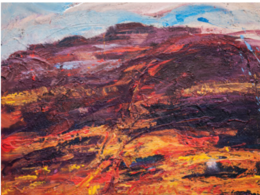
Jordanija, Wadirum, 2016, akril, platno, 80 x 60 cm