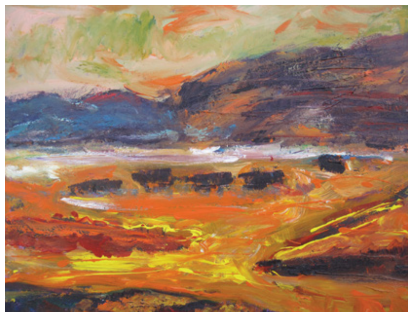
Jordanija, 2017, akril, platno, 100 x 80 cm