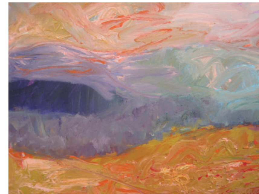
Jordanija, 2016, akril, platno, 100 x 70 cm