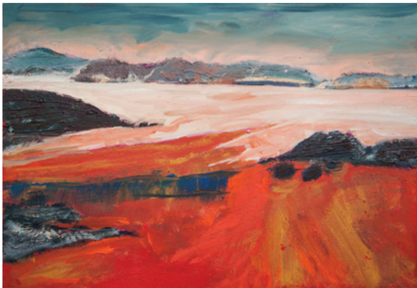
Jordanija, Wadirum, 2016, akril, platno, 100 x 70 cm