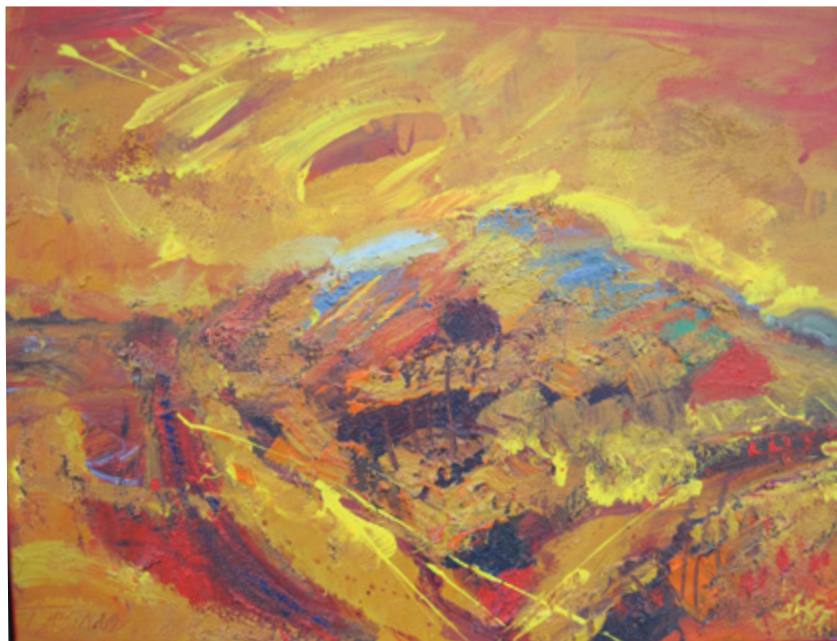
Jordanija, 2016, akril, platno, 70 x 50 cm