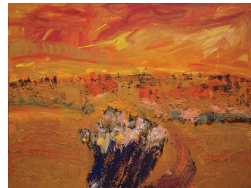
Jordanija, 2016, akril, platno, 80 x 60 cm