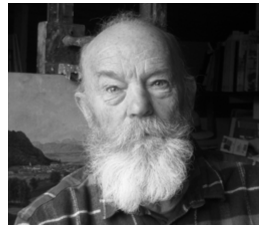
Fotografija: Iztok Premrov 1979, 2021