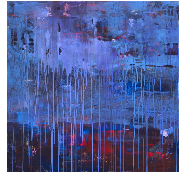
1603 – 2016, 100 x 100 cm, akril na platnu