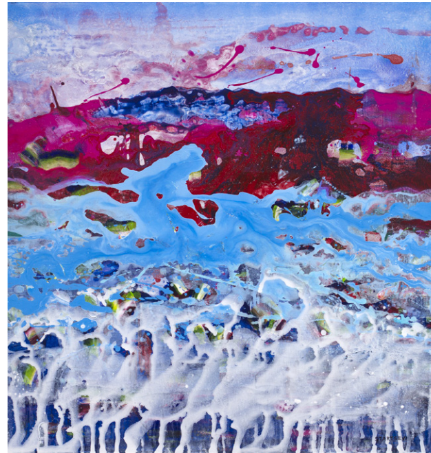
1601 – 2016, 107 x 107 cm, akril na platnu

Na naslovnici: 1406 – 2014, 110 x 120 cm, olje na platnu