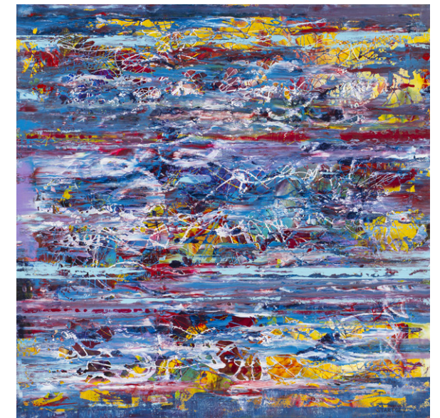
1604 – 2016, 100 x 100 cm, akril na platnu