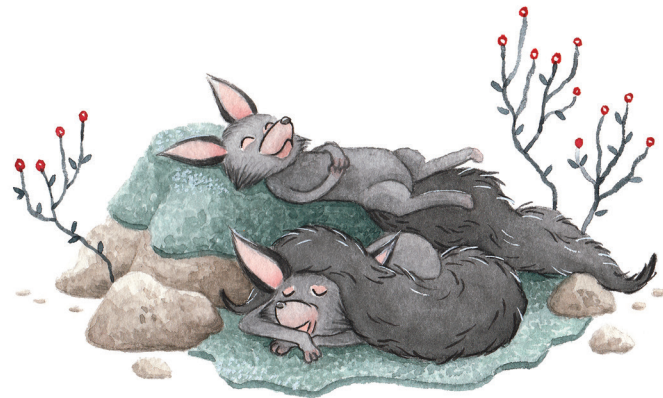
Uspavanka, Mi, kosovirji, 2019, 13 x 18 cm, akvarel in gvaš