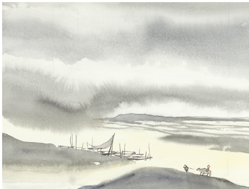
Bron in Sončnica, 2017, 20 x 30 cm, akvarel in tuš