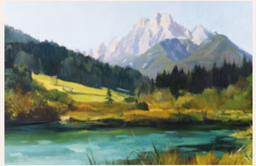
Jaka Torkar, Izvir Save, Zelenci, 1991, olje na platno, 55 x 85 cm