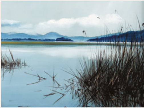
Tomaž Perko, Cerknisko jezero, 1986, olje na platno, 60 x 75 cm