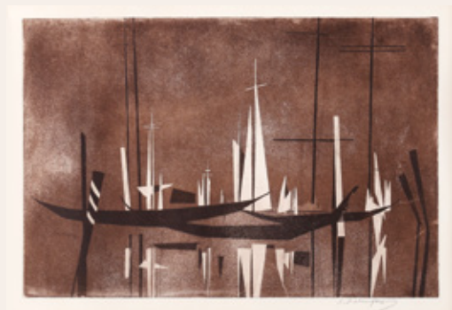
Riko Debenjak, Jadrnice, litografija, 52 x 72 cm