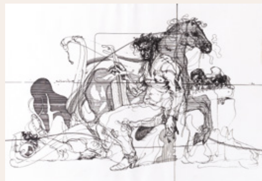
Bard lucundus, Krpan in Brdavs, 1981, sitotisk, 50 x 70 cm