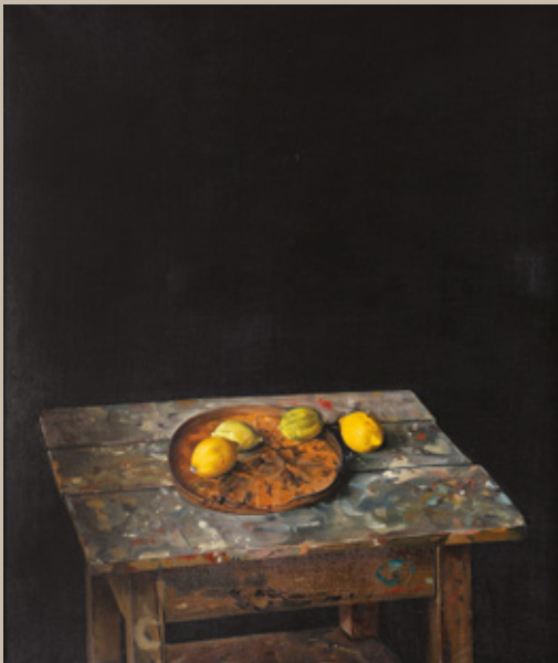
Darko Slavec, Tihožitje z limonami in mizo, 1974, olje na platno, 104 x 85 cm