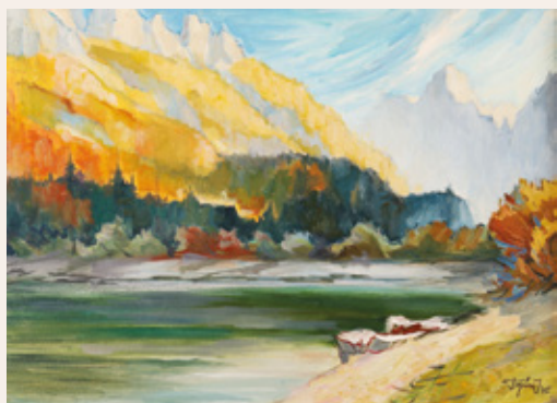
Jože Trpin, Gore ob vodi, 1985, akril na platno, 60 x 80 cm