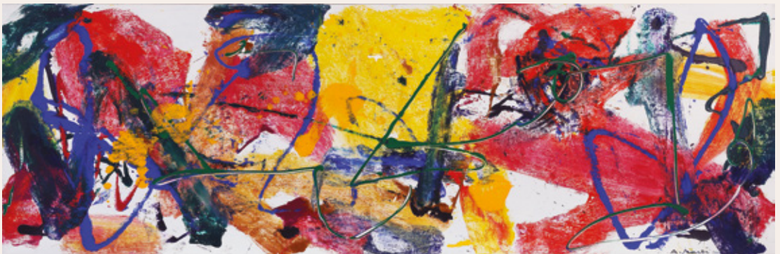
Andrej Jemec, Poti k soncu, 2000, akril na platno, 65 x 200 cm