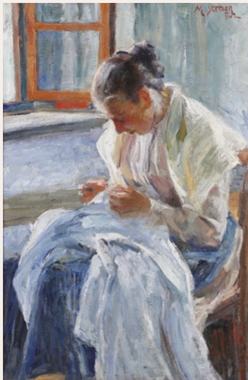
Matej Sternen, Pri šivanju, 1902, olje na platno, 104,5 x 69,5 cm