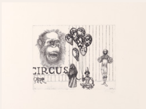
Karel Zelenko, Cirkusanti, 1972, jedkanica, 48 x 64 cm