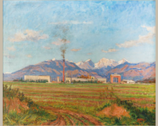
France Godec, Lek Mengeš, 1952, olje na platno, 82 x 100,5 cm