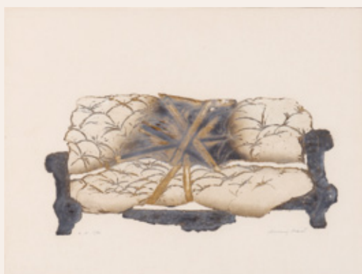
Adriana Maraž, Kanape, 1985, barvna jedkanica, 40 x 50 cm