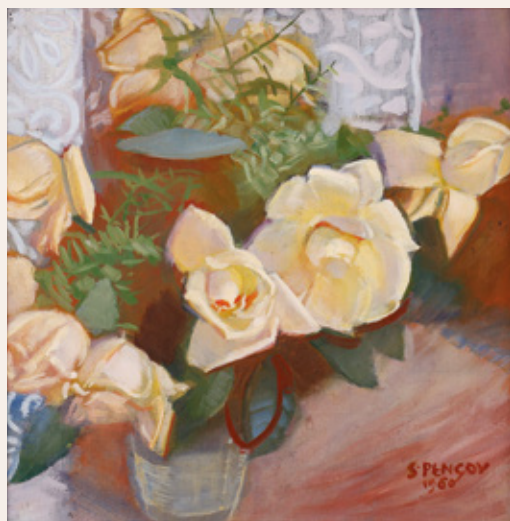
Slavko Pengov, Tihožitje, 1960, olje na platno, 42 x 42 cm