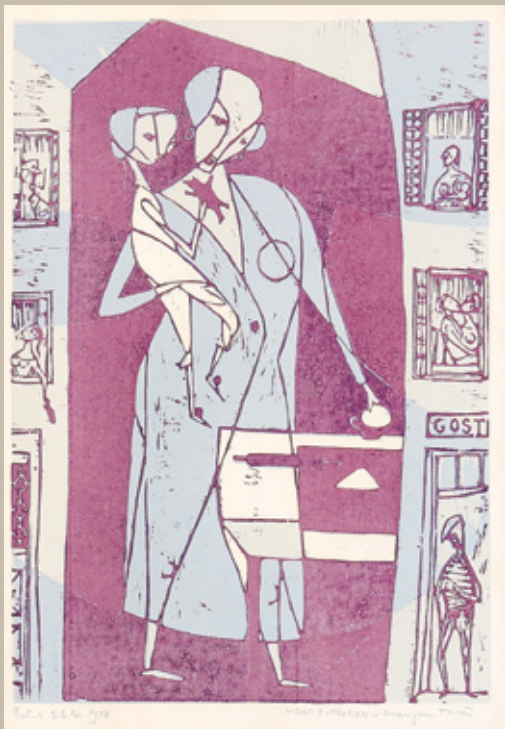
Marijan Tršar, Mati z otrokom, 1958, lesorez, 40 x 30 cm