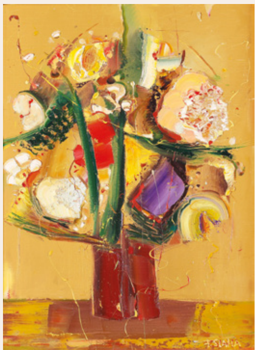
France Slana, Šopek, olje na platno, 70 x 50 cm