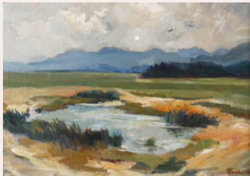
Lojze Perko, Cerkniško jezero, 1952, olje na platno, 45 x 64 cm