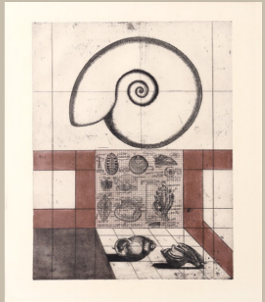
Bogdan Borčič, Velika školjka II, 1972, jedkanica, 77 x 66 cm