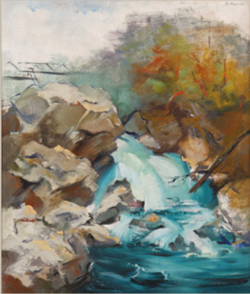
France Pavlovec, Krajina, olje na platno, 63 x 53 cm