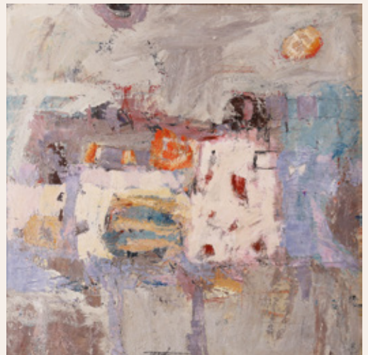
Rajko Čuber, Bela narava, 1996, akril na platno, 60 x 60 cm