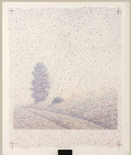
Boris Jesih, Samotno drevo, 1986, litografija, 80 x 67 cm