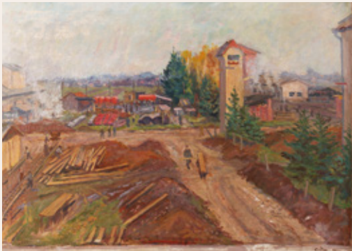
France Godec, Gradbišče, 1952, olje na platno, 60 x 82 cm