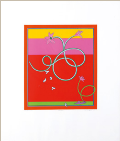
Metka Krašovec, Palenque, 1999, sitotisk, 75 x 65 cm