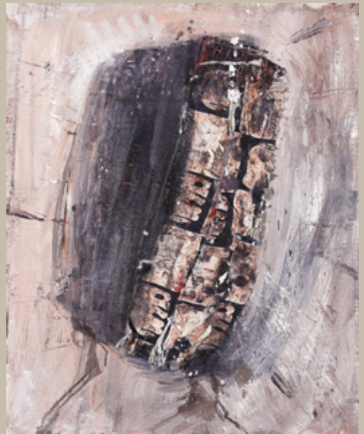
Ivo Prančič, Brez naslova, 1994, mešana tehnika, 50 x 40 cm